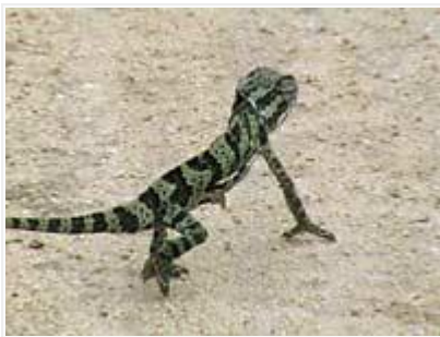
Ei mitään kiirettä...

S1:ltä käännyin etelään (vasemmalle) tielle S3 (Albasini Road) kohti Pretoriuskopin leiriä. Tämä hiekkatie tiheiden metsien halki on suositeltujen reittien joukossa Krugerin lintukarttavihkosessa (Kruger Park Birding Map). Olin kuitenkin liikkeellä hiljaiseen aikaan puolenpäivän jälkeen. Merkittävimpinä havaintoina vain pikkukotka, lauma kääpiömangusteja (jälleen) ja Mestel Dam juomapaikalla urosleijona, joka makasi pää koholla lammen takana metsän reunassa. Siltä paikalta se havaitsisi kaikki lammelle tulevat eläimet, pysyen kuitenkin itse osittain piilossa.