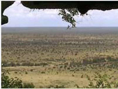
"Juuri tätä tulimme Afrikasta hakemaan!"

H1-3:n varrella mainittavimpana kirahvin raato, jonka ympärillä päivysti kelojen latvoissa 8 savannikorppikotkaa, 2 huppukorppikotkaa, 1 korvakorppikotka ja 1 rosvoahukka, ja koko joukko lisää korppikotkia kaartelemassa korkeuksissa. Poikkesin pienelle sivutielle S32 (Orpen Dam Loop), jonka varrella kaunis näköalapaikka (jaloittelumahdollisuus) alhaalla laaksossa olevalle padolle, jossa kalasteli goljathaikara. Myös etelänkalkkunasarvekas 1/1 tämän tien varrella. S32:n eteläpäässä käännyin etelään H10 :lle, joka lähti nousemaan ylös kohti Nkumben näköalapaikkaa. Se olikin käymisen arvoinen: fantastinen maisema 368 metrin korkeudelta länteen päin oli yhtä upeaa savannia horisonttiin saakka. Norsuja vaelsi siellä pieninä pisteinä kuin jossain paratiisimaalauksessa. Magneettinen näkymä! Helppo yhtyä paikalla olleen ruotsalaisseurueen sanoihin: "Juuri tätä tulimme Afrikasta hakemaan!" .