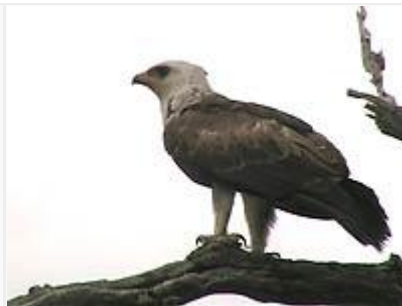
Sirokotka on Krugerissa päivittäinen näky.

Tie nro H13-2: Tämän 4km pituisen Punda Marian leirin sisääntulotien varrella varhain aamulla hyvin lintuja, muun muassa klo 06.00 savannivarpuspöllö aktiivisesti äänessä lähellä tietä. Tavallisten antilooppilajien lisäksi mainittakoon tien vierustan tiheikön suojassa piilotelleet kaksi suniantilooppia; tämä vaikeasti nähtävä miniatyyriantilooppi, korkeutta vain 35cm, ruokailee ilta- ja aamuöisin ja esiintyy Krugerissa vain puuston pohjoisosassa.