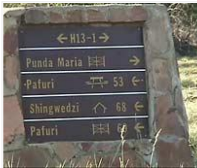
Risteyksissä on hyvät opasteet.

Retkeily Krugerissa tapahtuu kävellen leirien sisällä ja autolla niiden ulkopuolella. Autossa on pysyttävä sisällä, jaloittelu on mahdollista vain sallituilla paikoilla, kuten näköalapaikat ja lintupiilot; tämä sääntö on ehdoton, rikkojaa rangaistaan erittäin kovilla sakoilla – mikäli olet vielä hengissä, sillä leijonien kanssa ei ole leikkimistä. Lähes jokaisessa leirissä on mahdollisuus osallistua ilta- tai aamuretkille oppaan ja maastoauton kera. Nämä retket kestävät 2-3 tuntia ja maksavat noin 15 euroa/aikuinen. Itselfäni ne jäivät kokeilematta, omat retket riittivät ihan hyvin. Suunnistautuminen oli helppoa: kaikki tiet ovat numeroituja, hyvin merkittyjä ja risteyksissä on selkeät opasteet. Leirien portit ovat öisin suljettua ja kaikkien on ehdottomasti yövyttävä leirien sisällä. Kesällä marras-tammikuussa portit ovat auki 04:30-18:30, talvella touko-heinäkuussa 06:00-17:30 ja keväisin sekä syksyisin 05:30-18:00. Vaikka olin "lomalla" niin klo 04:30 liikkeelle lähtö ei tuottanut mitään vaikeuksia, niin jännittäviä aamut olivat. Siihen kellon aikaan oli vielä melkein pimeää, mutta lintukonsertointi oli jo täydellä voimalla käynnissä ja ei aikaakaan, kun aamu valkeni hyvin nopeasti. Etenkin viirusiipifrankoliinit huutelevat karheata kaklatustaan jo aamuyöstä lähtien.