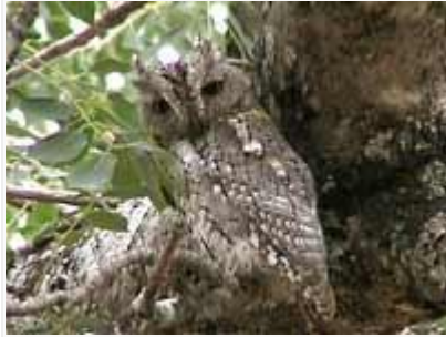
Ystävällinen henkilökunta näytti afrikanpöllösen.

ihan tarkan paikan, ja niinpä ei aikaakaan kun erään majoitusmökkin pihapuussa, ihan runkoa vasten älyttömän hyvin naamioituneena, sain katsella tätä somaa pientä pöllölajia. Aivan leirin portin ulkopuolella, H1-4 tien avoimessa maastossa oli myös samoja lajeja kuin leirissä: eräässä vähän tiheämmässä ja pusikkoisemmassa kohdassa kuhisi miljoonakutoja ja noin parikymmentä helttakottaraista, kultakurkkulepinkäinen ja akaasiatöpösiieppo.