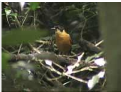
Pyövelipunarakas on naamioitunut nimensä mukaisesti.

Ajo-ohje: Entumenin metsä sijaitsee Eshowen kaupungista länteen. Dlinza Forestin portista kadulle tultaessa (Kangella Street), käänny vasemmalle (länteen) ja jatka suoraan Nkandlan suuntaan noin 13km kunnes näet sarvikuonokyltin tien vasemmalla puolen. Käänny kyltin osoittamalle tielle ja jatka noin 3,5km kunnes näet oikealla puolen pienen kyltin (huono ja epäselvä) ja portin, joka johtaa Entumenin metsään. Portti ei ole lukossa, aja 20m pienelle levennykselle (parkkipaikalle). Tie jatkuu tästä eteenpäin huonompana, joten paras jatkaa kävellen parisataa metriä piknikpaikalle, josta lähtee polku metsään. Parkkipaikan vieressä on pari henkilökunnan mökkiä, kerroin heille meneväni metsään. Entumenin metsään ei ole pääsymaksua. Toivottavasti Entumenin metsä saisi lähitulevaisuudessa osakseen myös samanlaiset kunnon polut ja muut järjestelyt kuin Dlinzassa on tehty. Paikassa on selvästi potentiaalia.