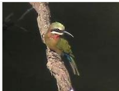
Jokimehiläissyöjä oli yleinen Luvuvhujoen sillalla.

Luvuvhujoen silta: Tultuani S64:lta pysähdyin puoleksi tunniksi kiikaroimaan ja videoimaan Luvuvhujoen sillalle (autosta saa poistua sillan keskikohdalla omalla vastuulla). Vesi oli hyvin alhaalla ja hiekkaiset rantapenkereet olivatkin paljastuneet laajalta alueelta. Sillalta käsin näin muun muassa huikean suuren afrikankeisarikalastajan, rosvoaukan ahdistelemassa nuorta gasellikotkaa, kultakurpon, goljathaikaroita, afrikanvästäräkkejä ja jokimehiläissyöjiä. Aivan sillan lähellä juomassa käyneitä norsuja pääsi kuvaamaan tavallisesta poiketen yläviihosta kuvakulmasta.