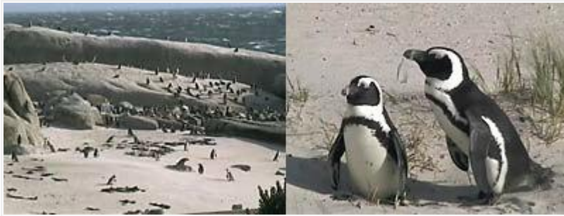
Ensimmäinen afrikanpingviinipari pesi Bouldersissa 1983, nyt paikalla on yli 2000 vanhaa lintua.