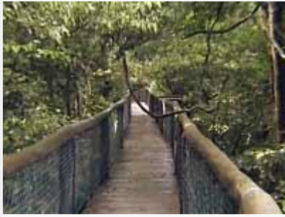
"Aerial Boardwalk" toi metsän ja etenkin sen latvuston elämän käden ulottuville.