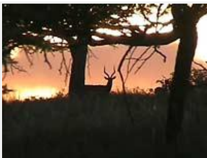
Aamutunnelma Mkhuzessa, impalauros tarkkailee.

Mkhuzen ehkä yleisin ja ainakin kuuluvain laji on pensasbulbuli, eräin paikoin sen laulua kuului jatkuvasti, laulusäe on käännetty osuvasti englanniksi: " willie, come and have a fight, sca-a-a-ared " – se tosiaan kuulosti aivan tältä! Paljon mukavaa tuli nähtyä, mutta jäi toki jotakin puuttumaankin, etenkin lajeja, jotka esiintyvät levinneisyytensä etelärajalla Mkhuzen alueella: afrikanharlekiini, ruusuhelmipeippo, mosambikinmedestäjä, töyhtöparatiisimonarkki, lyijyvahanokka jne. Olisin toivonut näkeväni myös paremmin sarvikuonoja, onhan Mkhuzen päätehtävänä suippohuulisarvikuonojen suojele (66 yksilöä v.2004), mutta näin vain yhden yksilön hyvin kaukana kävelemässä pois päin. Sarvikuonot ja muut eläimet olivat nyt kovilla, sillä Mkhuze oli kärsimässä pahinta kuivuuttaan yli 50 vuoteen. Siitä huolimatta korjauksia ja parannuksia oli vireillä, muun muassa uudet vastaanottotilat puiston portilla olivat rakenteilla.