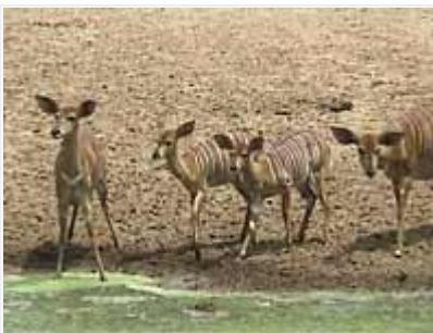
Nyalauros ja kauniit raidalliset naaraat ovat kuin kaksi eri lajia!

Kumahlahla Hide: Tämän ison piilokojun edessä on myös juomapaikka, jossa kävi varttitunnin aikana muun muassa kyhmysorsapari ja tamburiinikyyhky sekä karhupaviaaneja, pahkasikoja ja isokuduja. Lähistöllä kiertävän 4,5km silmukan varrella (piilokojulta Kwajoben kulttuurikylän suuntaan) oli muun muassa kääpiömehiläissyöjäpari, afrikansininärhiä, sirppisäihkyjä, vihersäihkyjä, helmibulbulilepinkäinen, akaasialepinkäinen, paratiisileski 1/, nokitiainen, viiksirastas ja savupääkalastaja. Silmukka kiertää lähellä Mkuzejoen rantoja, joten näkyvillä oli mukavat määrät suuria, upean keltarunkoisia kuumeuita.