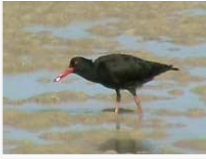
Afrikanmeriharakoita on jäljellä alle 5000 yksilöä.

Yzerfontein: Pieni rannikkokaupunki, tai oikeammin kesämökkikylä, sijaitsee kansallispuiston eteläreunalla. Aamuvarhain rantabulevardin kallioilla paistatteli aamuauringossa peräti 13 afrikanmeriharakkaa! Kauempana näkyvällä korkealla kalliosaarella kuivatteli kapinmerimetsoja 55, matalikkomerimetsoja 5 ja afrikanmerimetsoja 2.