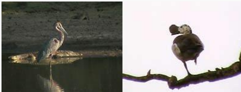
Kanniedood Dam: goljathaikara, niilinkrokotiili ja kyhmysorsa.

Kanniedood Dam: Sen sijaan vehmaiden jokivarsimetsien reunustama kaunis Kanniedood Dam tarjosi paikalla viettämäni yhden illan ja aamun aikana perin juurin afrikkalaista luontoa parhaimmillaan. Tämä keinotekoinen Shingwedzjoen patoallas sijaitsee aivan Shingwedzin leirin eteläpuolella. Padon länsirantoja myötäilevän tien (S50) varrelta on muutamia tähystyspaikkoja (autosta käsin) ja yksi iso katselupiilo. Kuivuus vaivasi täälläkin, vettä oli vain padon keskivaiheilla ja muutamia kuivuvia lätäköitä siellä täällä. Eläimet olivatkin kerääntyneet joukolla tämän ehtyvän vesilähteen äärelle. Virtahevot puhisivat ja mörähelivät aamuhämärissä aivan lähellä ja illalla kymmeniä niilinkrokotiileja paistatteli loivilla rannoilla, norsut nousivat kylvystä ja marssivat aivan edestäni, ja olihan siellä lintujakin: muun muassa afrikansatulahaikara 1/1, afrikanmarabu 4, goljathaikaraita, piispahaikara 1, afrikankapustahaikara 8, afrikanrakonokka 2, kiljumerikotka 2, arosuohaukka 1/, kyhmysorsa 2 ja afrikantylli 1. Rantapaksujalkoja oli joen molemmin puolin, eräs niistä kulki muutaman metrin päästä auton vierestä. Uikuttajakyyhky taapersi tien reunalla ja muutamia tuliruupeippoja myös tien pientareella, vihersäihkyt ja afrikanviherkyyhkyt tutkivat puiden antimia ja koko ajan kuului eri puolilta afrikanmetsäkalastajien voimakkaita trillejä "krit-trrrrrrr". Pieni ja arka maa-antilooppi pujahti piiloon rantametsään, ja sinne hävisi myös parimetrinen niilinvaraani.