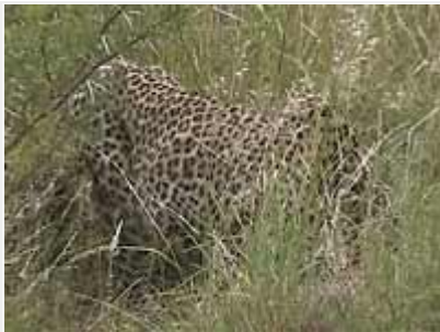
Leopardi oli yllättäen hyvin lähellä.

Lopputaipaleella (tie nro H1-4) odotti yllätys. Leopardi oli muutaman sekunnin verran näkyvissä hitaasti hiipien, jähmettyi paikalleen ja syöksähti nopeasti loikaten tien alle sadevesitunneliin. Tunnelissa lymyilleet lepakot säikähtivät lentoon, mutta olivatko lepakot leopardilla kuitenkin tähtäimessä? Sinne se jäi pieneen tunneliin tien alle eikä sen koommin näkynyt vaikka odotin vartin verran tunnelin molempia päitä silmäillen – ja aiheutin melkoisen liikenneuhkan, kun yhä uusia autoja ja busseja pysähtyi uteliaana paikalle. Tällainen ruuhkailmiö on tyypillistä Krugerin päällystetyillä päteillä, jos vain joku on pysähtynyt tien varteen katsomaan jotain.