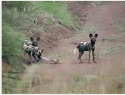
Toverien syödessä kukin hyeenakoira vartioi vuorollaan ympäristöä.

Kiertelin autolla puiston sisällä vain yhden päivän verran (12h), mutta pääsin silti jo melko hyvään alkuun Afrikan suurten nisäkkäiden parissa. Oli aikamoisen sykähdyttävää nähdä ensimmäistä kertaa suuria afrikannorsuja, kirahvien uljasta käyntiä mastomaiset kaulat huojuen, virtahepoja ja erilaisia antiloopeja sekä iltapäivän päätteeksi vielä kaksi sarvikuonoa juuri ennen kaatosateen alkamista. Lähtöamuna kävin vielä kävelemässä luontopoluilla Manyane leirin lähimaastossa. Kokemus oli mukava kun pääsi edellisen päivän autossa istuskelun jälkeen puoliavoimelle savannille kävelemään ja näkemään silmästä silmään lintuja ja antiloopeja sekä karhupaviaaneja, jotka majailivat suuren voimalinjan kannatinpylväissä. Luontopolkujen alue on aidattu, eikä sen sisäpuolella ole vaarallisia petoeläimiä kuten muualla puiston alueella. Siitä huolimatta kävelin aluksi vaistomaisesti varpaisillani ja tähyilin levottomana heinikkoa, jos vaikka leijona on edellisenä yönä sittenkin pystynyt hyppäämään aidan tälle puolen?