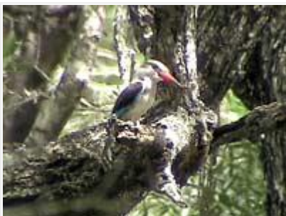
Savupääkalastaja asustaa Nylsvleyn metsissä.

Pohjoisosa (Vogelfontein) on valtavan suuri tulvakosteikko. Alueella on kolme lähekkäistä lintutornia, joilla on yhteinen parkkipaikka. Kauimpana olevalle parhaalle tornille (Dabchick) on parkkipaikalta kävelymatkaa vain 500m. Valitettavasti tornien parkkipaikalla ei ole vielä saniteettitiloja. Jo ennen parkkipaikalle saapumista kannattaa tähyillä Vogelfonteinin suuren aukean reunamille: havaitsin raitapyrstökottaraisia langoilla ja tuhkahyppiä. Pientareiden heinikoissa oli punaruusupeippoja. Ympäristö on avointa, yhden tornin ympärillä on pieni metsikkö. Alueen hallitsee hyvin lintutorneista kaukoputken avulla. Aivan Dabchick tornin juurella hiippailevat afrikanjassanat, kurnuliejukanat, mustahuitit ja sulttaanikanat tarjosivat loistavia kuvausmahdollisuuksia. Dabchick tornille kävellessä niityn pinnassa saalisteli kaksi isotörmäpääskyä (harvalukuinen pesimälaji). Lintujen lisäksi riitti muutakin katseltavaa, etenkin illalla, jolloin isoruokoantiloopit, aroseprat, sassabianantiloopit, isokudut, ellipsivesiantiloopit ja juovagnut saapuivat avoimeen saraikkoon syömään. Ennen kuin lähdet ajamaan Vogelfonteiniin muista ottaa avain mukaan lintutornien portteja varten pääportin toimistosta, ja mikäli yövyt leiripaikalla, muista palata takaisin klo 18:00 mennessä, jolloin portti suljetaan. Mikäli myöhästyit, voit toki jättää auton portille ja kävellä muutaman sadan metrin matkan leiripaikalle.