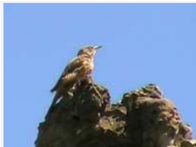
Maatikka, omituinen "puuton" tikka.

Swartberg Pass oli huikea ajo- ja maisemakokemus, ja sen varrelta kertyi muutama lintuhavaintokin. Tämä kapea solatie, varsinainen insinöörien ja lapiomiesten taidonnäyte (tehty yli 100 vuotta sitten vankityövoimalla), lähtee tasaiselta karrulta ja kipuaa Swartberg vuorten yli rannikolle päin. Havaitsin heti huipun ohitettuani ja tultuani vuoren kosteammalle eteläpuolelle, fynboskasvillisuudessa (matalaa