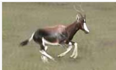
Kiiltävä, hyväkuntoinen valkopäätopi.

Tämän Etelä-Afrikan pienimmän kansallispuiston pinta-alasta suurin osa on matalaa fynbospensaikkoa. Kansallispuiston nimi juontaa kauniista antilooista nimeltään valkopäätopi (Bontebok, Damaliscus dorcas dorcas ), joita laidunsi nurmikoilla heti opastuskeskuksen tuntumassa sekä ympäri puistoa. Maisemaa elähdyttivät myös ruskeaturpaiset kapmaanvuorisieprat (vuorisiepran harvinainen alalaji) sekä kaurisantilooit. Lintuja alueella on havaittu noin 200 lajia. Kiertelin aamulla autolla puiston hyväkuntoisilla hiekkateilla ja sen jälkeen kiersin kävellen lyhyen polun puiston eteläreunalla Breedejoen varrella (vähän ruovikkoa ja akasiatiheikköjä). Odotin kovasti näkeväni parikin trappilajia puiston avoimessa maastossa, mutta sinnikkäästä kiikaroinnista huolimatta en onnistunut näkemään yhtään trappia päivän aikana. Muuten alue oli positiivinen kokemus; puolipäivää kestäneen käyntini havaintoja olivat muun muassa mustasuohaukka, kapinfrankoliini, kalottihemppo, afrikantiainen, sinikurki, sihteeri, kapinpensaslepinkäinen sekä helmi- ja pikkutörmäpääsky. Parhaita lintupaikkoja olivat Breedejoen leirintäalue polkuineen. Lauantaipäivästä huolimatta vierailijoita oli aika vähän. Opastuskeskuksesta saa alueen kartan sekä lintulistan, ja onpa ostettavissa myös puistosta tehty pieni kirjanen.