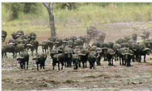
Satoja kafferipuhveleita saapumassa Grootvlei Damille.

Viitisen kilometriä etelämpänä, myös lyhyen sivutien päässä, ja hyvin kartalle ja maastoon merkittynä, sijaitsee suurehko ja avararantainen Grootvlei Dam in juomapaikka. Altaan pohjoisreunaa ympäröivältä korkealta pengertieltä avautuu parhaimmat näkymät. Paikalla oli klo 11:15-12:15 muun muassa: sihteeri 1/1, afrikansatulahaikara 1/1, mustahaikara a13, afrikanrakonokka a5 ja savannikotka 2 juv. Kaukaa vastarannan mopanemetsästä saapui tanner pölisten muutamia satoja kafferipuhveleita laajana rintamana, jessus mikä näky! Nautinnosta mylvähdellen ne kellahdivat matalaan veteen hakemaan helpotusta paahtavaan kuumuuteen. Paikalla oli myös aroseeproja ja 3 sassabianantilooppia. Tämä avararantainen juomapaikka on varmasti vilkkaassa käytössä myöhään illalla ja yöllä, mutta sijaitsee valitettavasti liian kaukana leireistä.