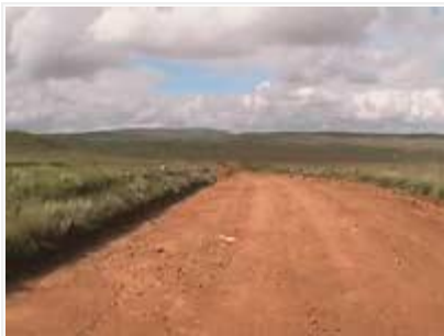
Dullstroomin ylängön avaruutta.