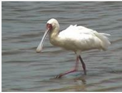
Afrikankapustahaikara, Rondevlei NR.

Kommetjie: Tämä kaupungin länsirantojen ulokemainen kulma toimi kohtuullisena merilintujen katselupaikkana etenkin päivänä, jolloin tuuli kovaa luoteesta. Tuulen kääntynyt kaakkoon ei seuraavana aamuna ollut paljoakaan katseltavaa. Kova tuuli toi linnut lähemmäksi, mutta kaukoputki oli silti välttämätön. Liitäjät hävisivät välillä aaltojen taakse ja putki täräsi tuulessa, joten helppoa ei ollut, mutta seuraavat tulivat nähdä: nokiliitäjä melko yleinen, pikkuliitäjä 2, isomeriliitäjä vähintään 5, muutamia merikihuja sekä töyhtö- ja riuttatiiroja. Kapinsuulia meni ohitse lähes jatkuvasti. Tarkkailupaikkana toimineen parkkipaikkakentän matalalla rantakalliolla oli afrikanmeriharakoita 2 + 5, töyhtömerimetsoja 3 ja matalikkomerimetso 1; kapinmerimetso ja afrikanmerimetso olivat yleisiä.